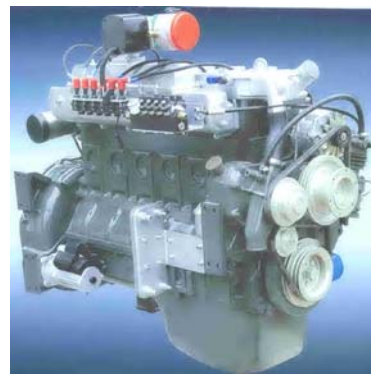
WT 618 Series Gas Engine